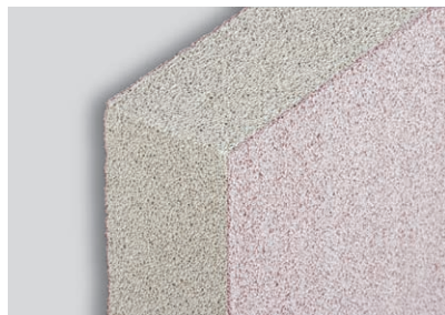
Pórobetonová izolační deska Ytong Multipor

Na své si na stavebním veletrhu přijde i odborná veřejnost. Výrobce se v Brně chystá představit svou letošní novinku v sortimentu, tvárnici třídy P6 pro bytové domy . Na odborníky rovněž čeká prezentace unikátních tepelněizolačních desek Ytong Multipor , které nabízejí široké spektrum využití v oblasti tepelných izolací a vápenopískových tvárnic Silka pro řešení akustických a nosných stěn.