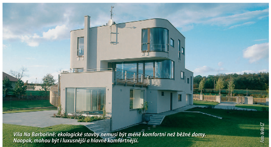
Vila Na Barbořině: ekologické stavby nemusí být méně komfortní než běžné domy. Naopak, mohou být i luxusnější a hlavně komfortnější.

Rozhodně se necítím vyhraněným ekologem. Postavili jsme si nový nízkoenergetický dům na venkově. Hlavním cílem bylo zajistit zdravé a pohodlné bydlení pro celou rodinu s rozumnými náklady. To, že náš dům je mnohem šetrnější vůči životnímu prostředí než běžné stavby, je samozřejmě skvělé a příjemné nás to hřeje.