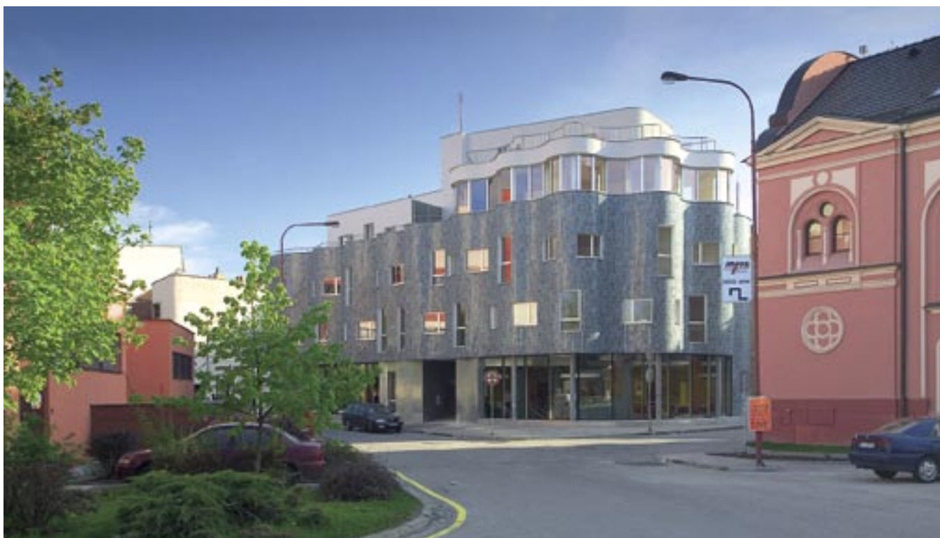
Na nároží je dům vyvýšen o jedno ustupující patro. Dojem lehkosti posilují pásová okna