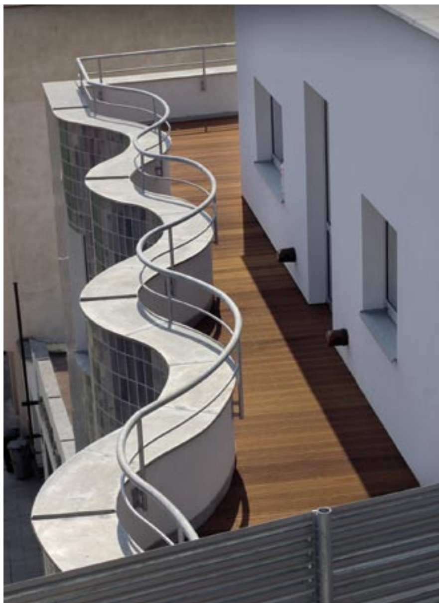
Tvar terasy je analogický s půdorysem domu

Obyvatelé Hradiště nemají příliš příležitostí narazit na neobvyklou architekturu. Jako všude jinde v České republice, i tady se poslední dobou hodně staví a opravuje, ale vše více méně v tradičním duchu. Kvěťák je výjimkou.