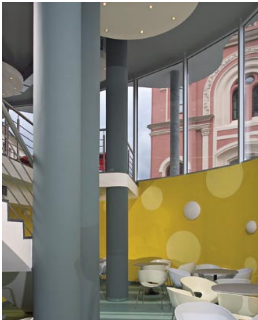
Interiér mezonetové kavárny na nároží. Průhledem vidíme synagogu

díčně tvarované fasádě, jsou tedy klasická; odpadá tak problém se zasklíváním dokulata, které je cenově náročné.