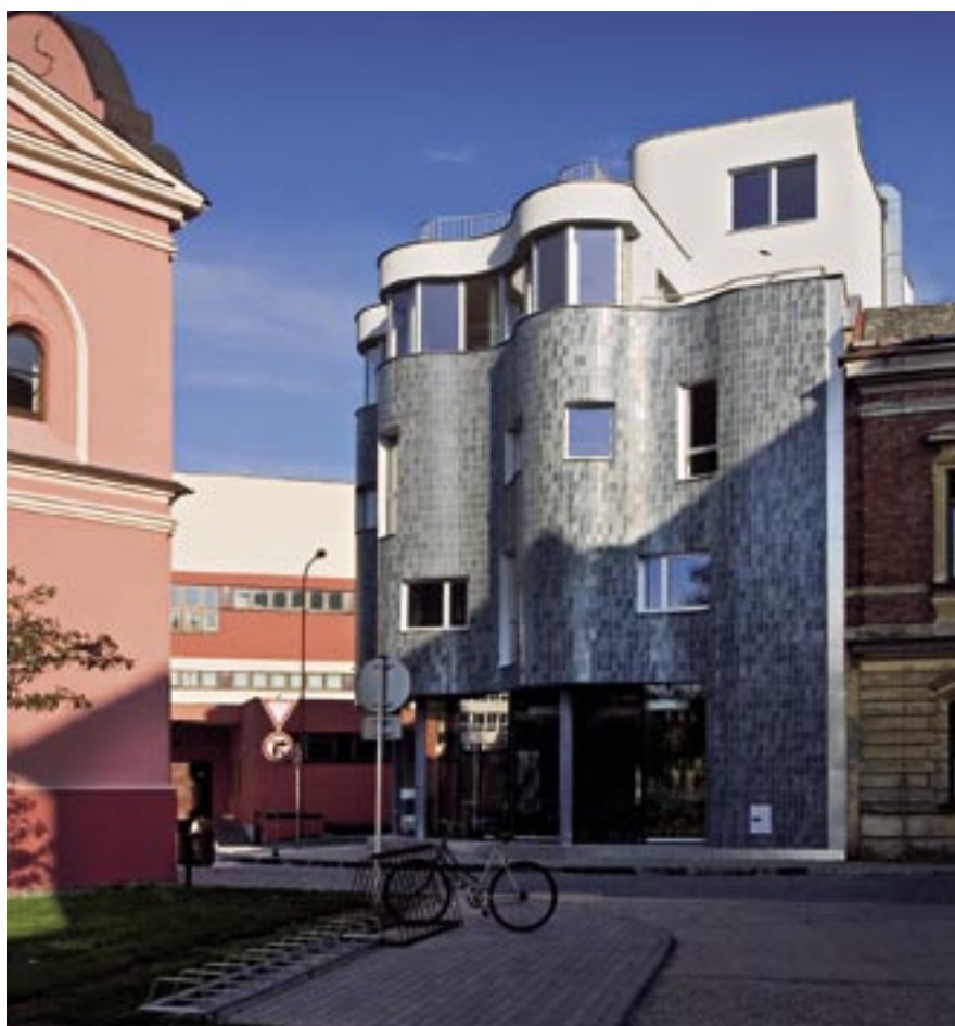
Vlevo vidíme část bývalé synagogy, která tvoří ke Květáku protiváhu. Návrh domu vzešel ze soukromého výběrového řízení. I na menší stavby se vyplatí soutěže vypisovat

Příhodnou přezdívku Květák získal dům v Uherském Hradišti architektonické kanceláře New Work Svatopluka Sládečka. Při cestě po hradištském hlavním tahu nelze vlny neobvyklého domu přehlédnout. Úspěšně konkurují blízké bývalé synagoze, dnešní knihovně, avšak neupozadují ji. Květák je sebevědomým příspěvkem současné architektury městu.